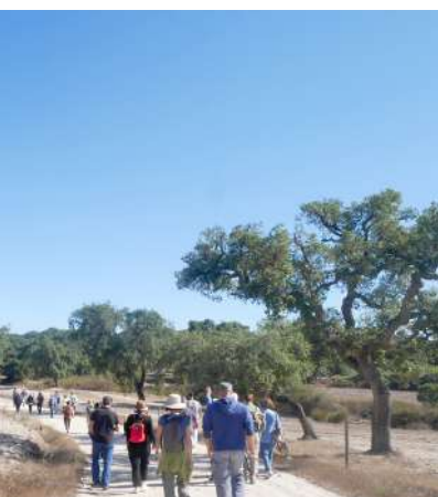
Caminheiros felizes em alegre cavaqueira.