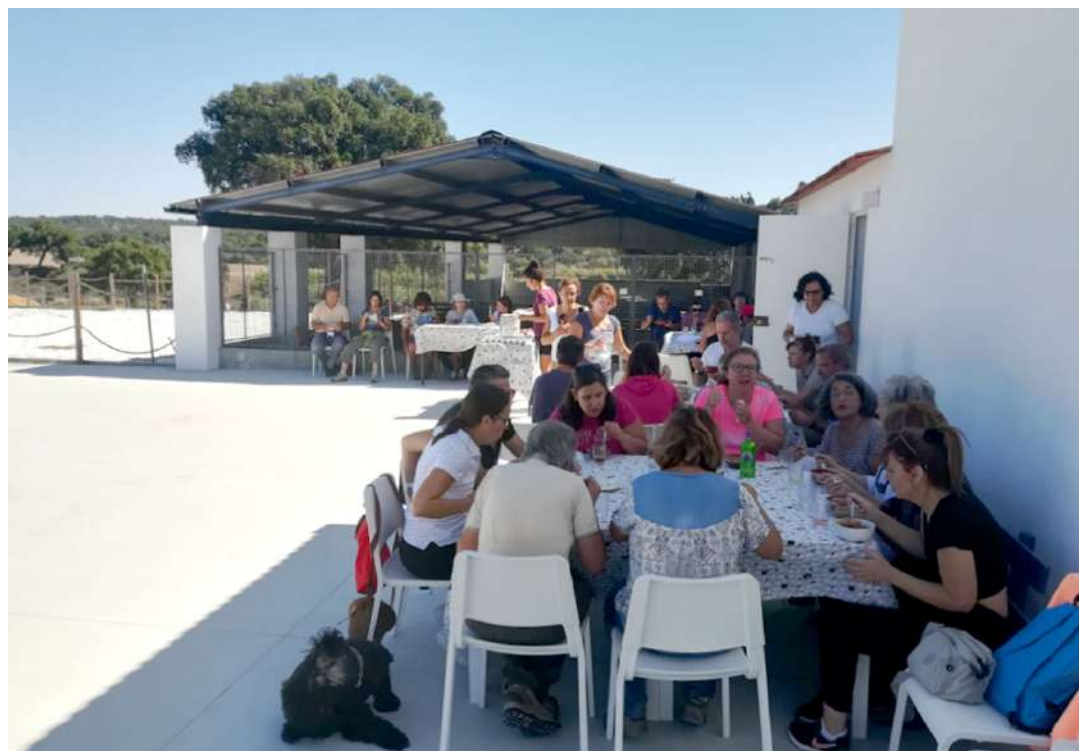
De regresso ao OPC o agradável convívio com excelente comida e vinho local.