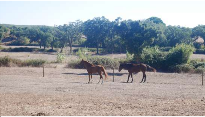
Nem só de relevo e vegetação vive a paisagem.

Texto Carlos Cupeto