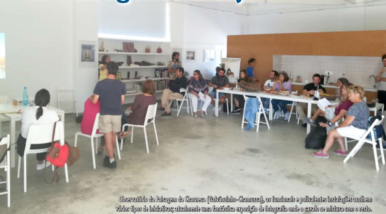
Observatório da Paisagem da Charneca (Galvãozinho-Chamusca), as funcionais e polivalentes instalações acolhem vários tipos de iniciativas; atualmente uma fantástica exposição de fotografia onde o cavalo se mistura com o resto.